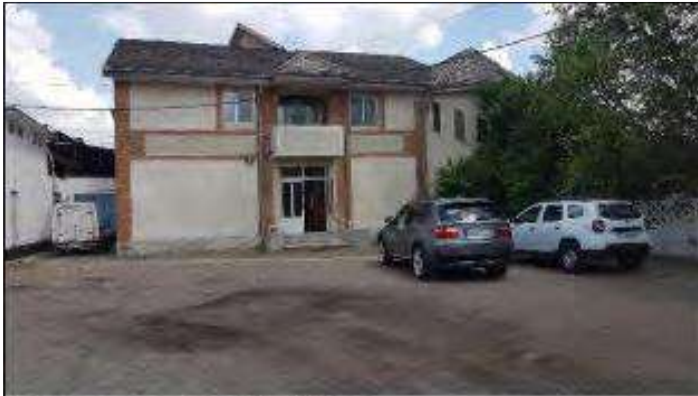
EXTERIOR CLD BIROU C41