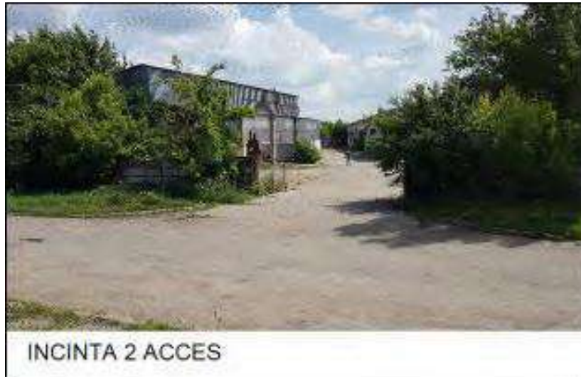
INCINTA 2 ACCES