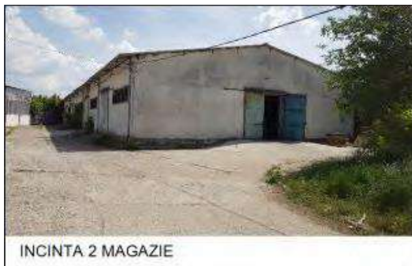
INCINTA 2 MAGAZIE