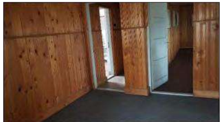
ETAJ 1 BIROU C41